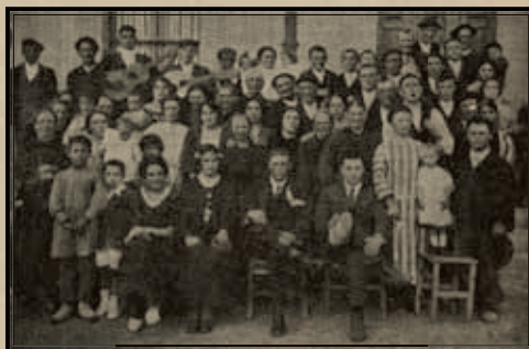
Bodas populares, Villavelayo.

Así pues, la revista El Najerilla supone un auténtico “índice de la vida regional tan querida”, una enciclopedia serrana, escrita de primera mano, sin pretensiones comerciales, con la intención de que los emigrantes en Hispanoamérica, en la Argentina y Chile especial-