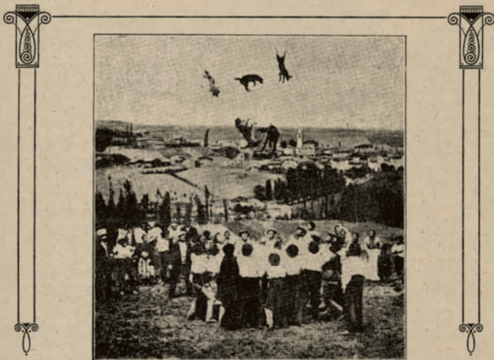
San Millán de la Cogolla.—Costumbres típicas - Manteamiento de perros.

de que carezco, sino simplemente defunciones, matrimonios, sorteo de quintos, etc., y las autoridades de cada pueblo, como Ayuntamientos, Jueces, etcétera; en una palabra: un índice de la vida regional tan querida. (...)